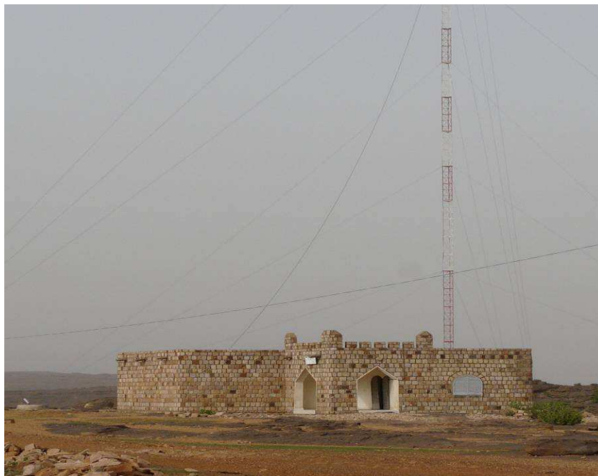
La radio rurale de Sangha fruit du partenariat développé autour du projet

L'équipe du projet a mobilisé un réseau de partenaires nationaux et internationaux (Projet d'appui aux Communes rurales de Mopti ; Kondo Jigima ; ONG française Via Sahel ; ONG française Bilou Toguna ; Suez aquassistance, Vision du Monde ; Les Amis de Sangha en France) en faveur de la promotion du tourisme durable à Sangha. Elle aura réussi à fédérer les interventions des acteurs étatiques tels le Ministère de