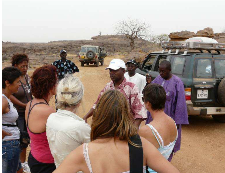
Une équipe de touristes et leurs guides entretenue sur le tourisme durable

Le projet Tourisme, dans la limite de ses capacités et même en dehors (fonds externes) a répondu aux besoins réels exprimés par les bénéficiaires. Les résultats probants mis en évidence, l'attestent pleinement. Cependant, comme évoqué dans le rapport d'Evaluation Externe, il est évident qu'un objectif aussi large tel que la promotion du tourisme durable à Sangha ne peut être atteint que dans le cadre d'une politique du développement du tourisme qui dépasse largement le cadre du projet. C'est pourquoi il s'agira de prendre en compte plutôt la large et riche contribution du projet à ce processus.