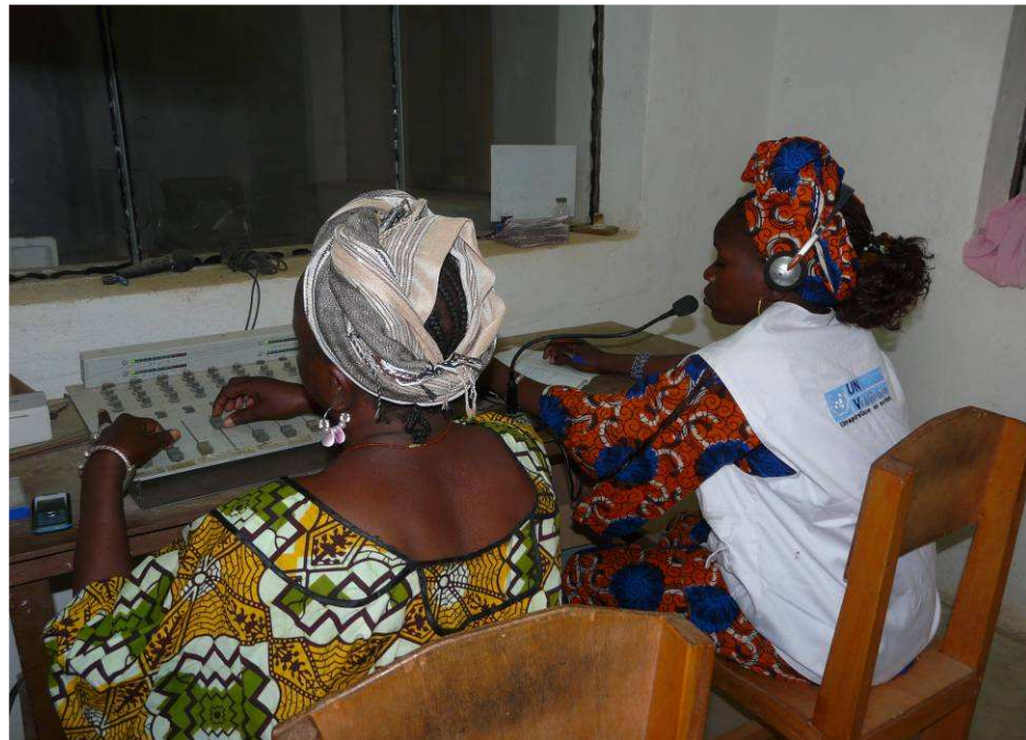
La sensibilisation peut aujourd'hui se poursuivre à travers la radio et ses animatrices volontaires locaux.

Enfin de nombreux partenariats développés au cours de la