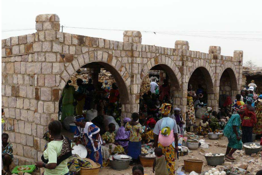
La réalisation d'un hangar facilite la gestion du marché et améliore son assainissement

En outre, la proximité des VNU, leur connaissance du milieu leur aura permis de jouer un rôle d'appui/conseil aux villages,