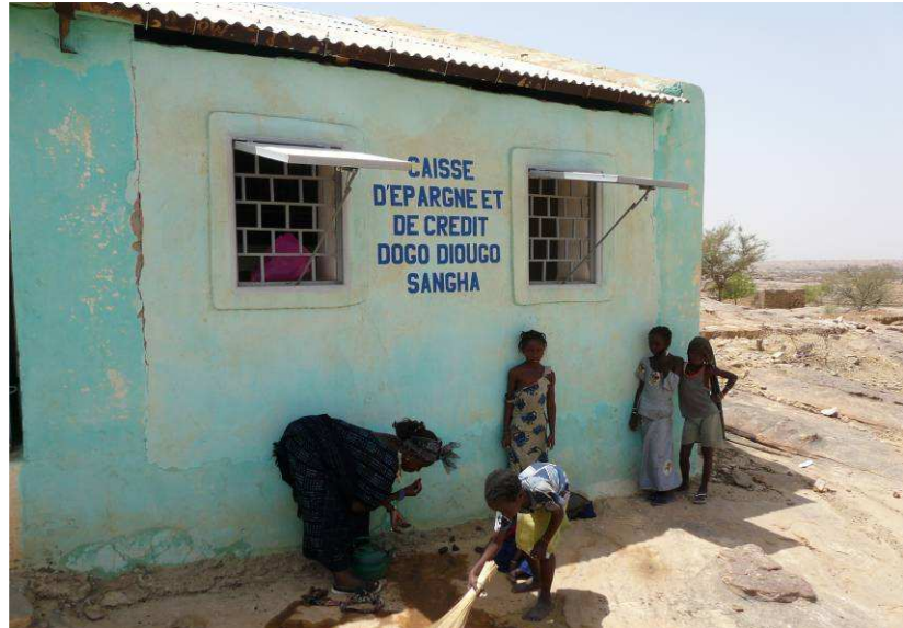
Caisse d'épargne et de crédit « Dogo Diougo » de Sangha

La Caisse d'épargne et de crédit « Dogo Diougo » constitue un des résultats probants du projet Tourisme. Sa mise en place a permis la création de trois emplois directs : 1 gérante, 1 gérant adjoint et 1 gardien. Le nombre de ses adhérents est passé