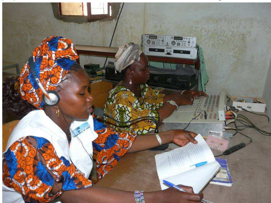
La Radio de Sangha Animée par des « Volontaires Locaux » formées et encadrées par les VNU

Les activités quotidiennes des volontaires ont eu un effet d'entraînement extraordinaire sur les populations et les acteurs du tourisme à sangha. Cela a favorisé la Promotion du volontariat local avec comme aboutissement la mise en place de deux comités de volontaires locaux : le comité de gestion du marché et le Comité pour la protection du Patrimoine. Le premier est chargé de l'assainissement (37 membres dont 11 femmes) et le second de la préservation du patrimoine naturel et culturel (55 membres dont 18 femmes).